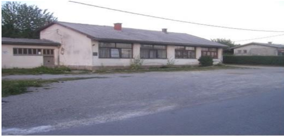
Prva školska zgrada u Liskovcu izgrađena 1955. godine