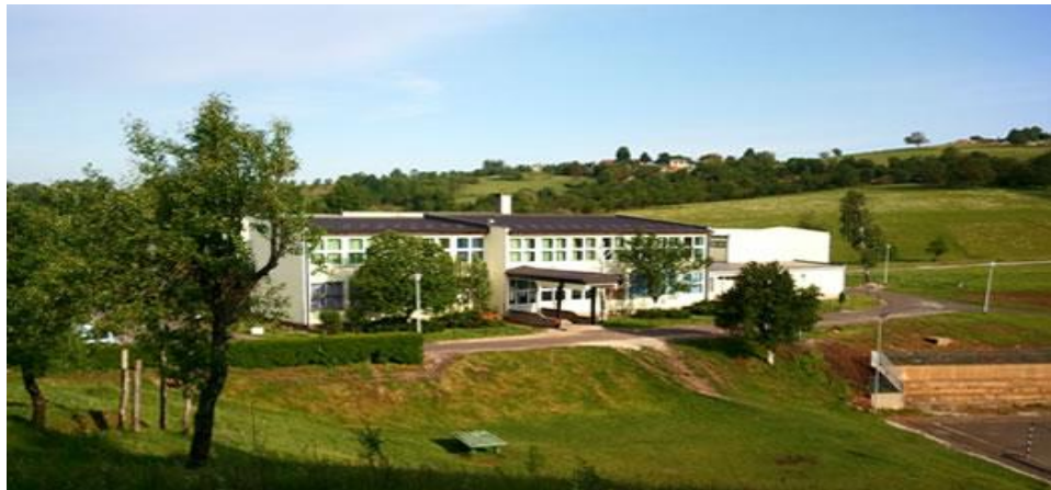
Sadašnja školska zgrada u Liskovcu izgrađena 1980. godine

Zahvaljujući angažovanosti radnika škole, od završetka rata do danas došlo je do oštećenja škole, tako da škola sada ispunjava osnovne higijenske i estetske uslove za normalno odvijanje nastave.