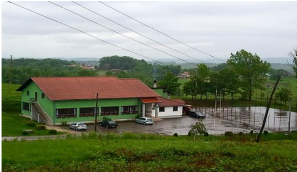
Nova školska zgrada područne devetogodišnje škole u Krivaji

U seljenjem u novu zgradu školske 2007./'08. godine prešlo se na postepeno uvođenje područne osmogodišnje odnosno devetogodišnje škole.